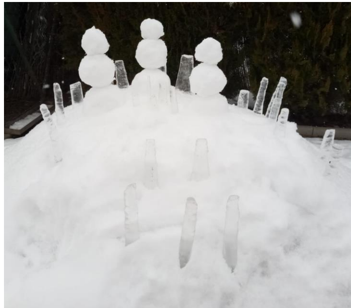
Kačka V. (3. B)

Ano přátelé, kamarádi, únor bílý pole sílí, mráz čaruje, covidák pokračuje, konec on-line výuky v nedohlednu. Před námi jarní prázdniny, a také nové číslo školního časopisu, juchů. Mám obrovskou radost, že se nám naše společné dílo daří, moc děkuji všem, kteří měrou vrchovatou přispěli do tohoto čísla, je to paráda. Doufám, že se pobavíte, zasmějete, zastavíte, nadchnete a nadechnete, rozzáříte, prostě a jednoduše, přeji příjemné počtení všem.